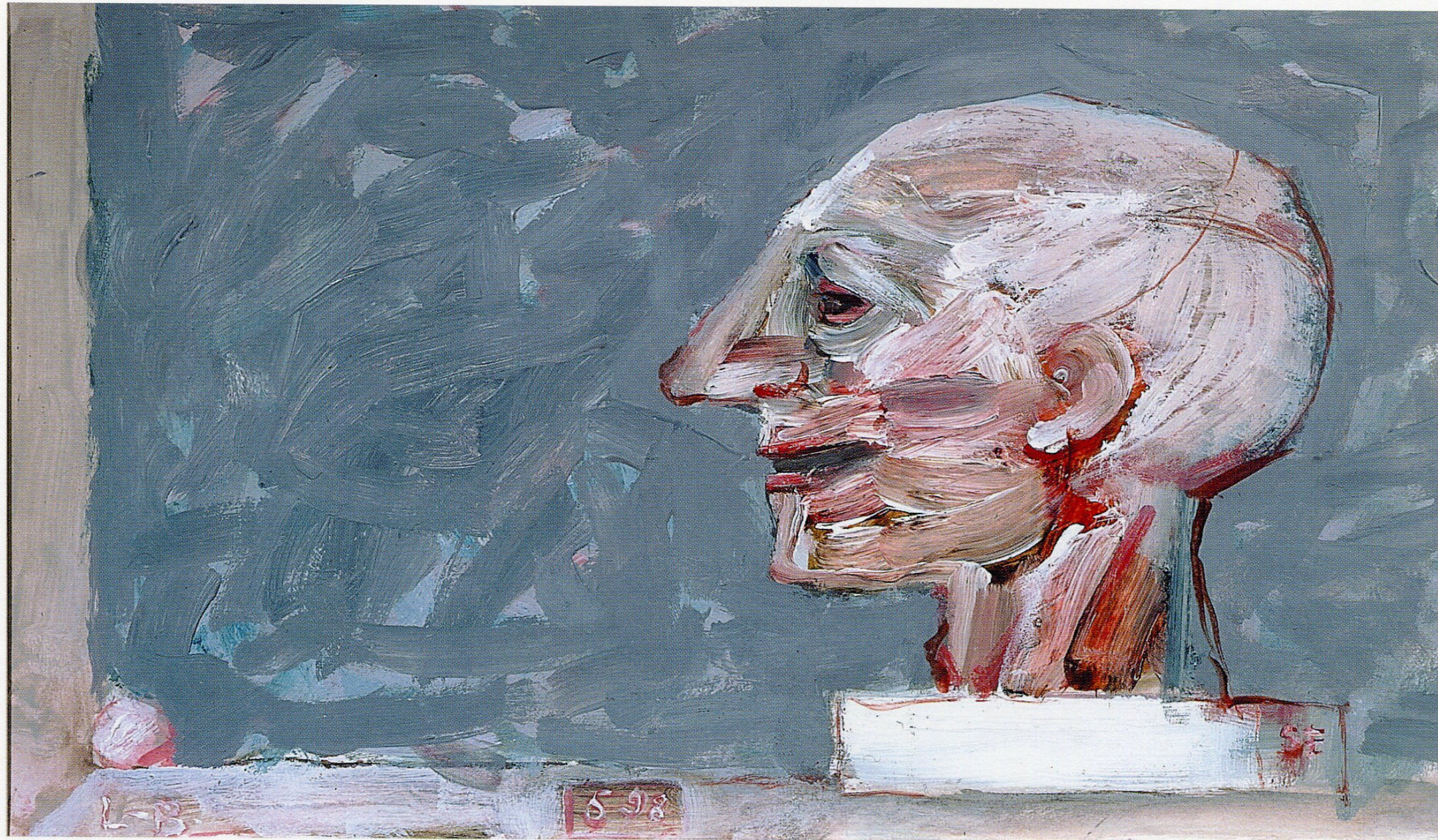
64 - TÊTE D'ÉCORCHÉ - 1998