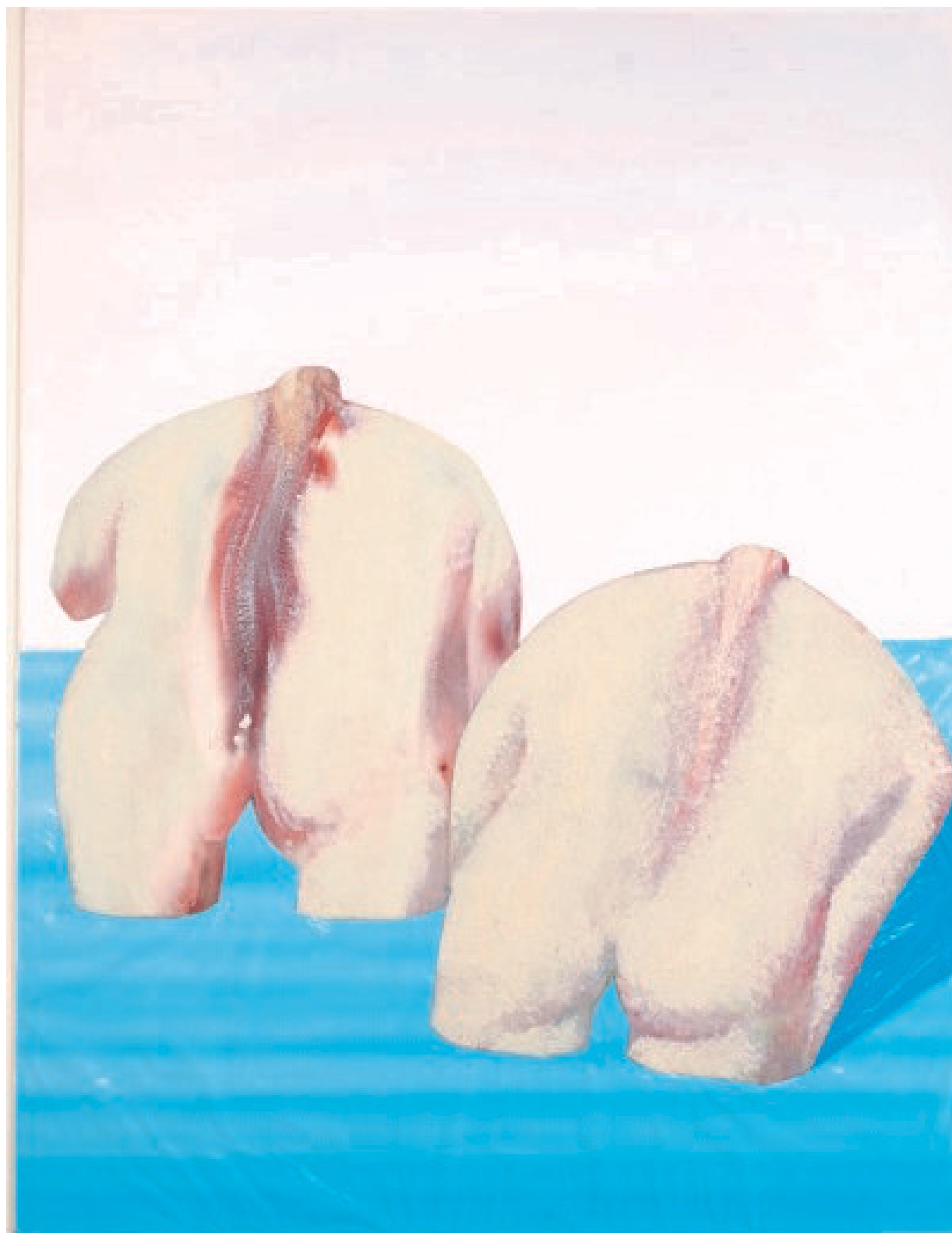
Deux dos féminins , acrylique, film plastique coloré, collage sur papier, 64 x 49 cm, 1980, Paris.