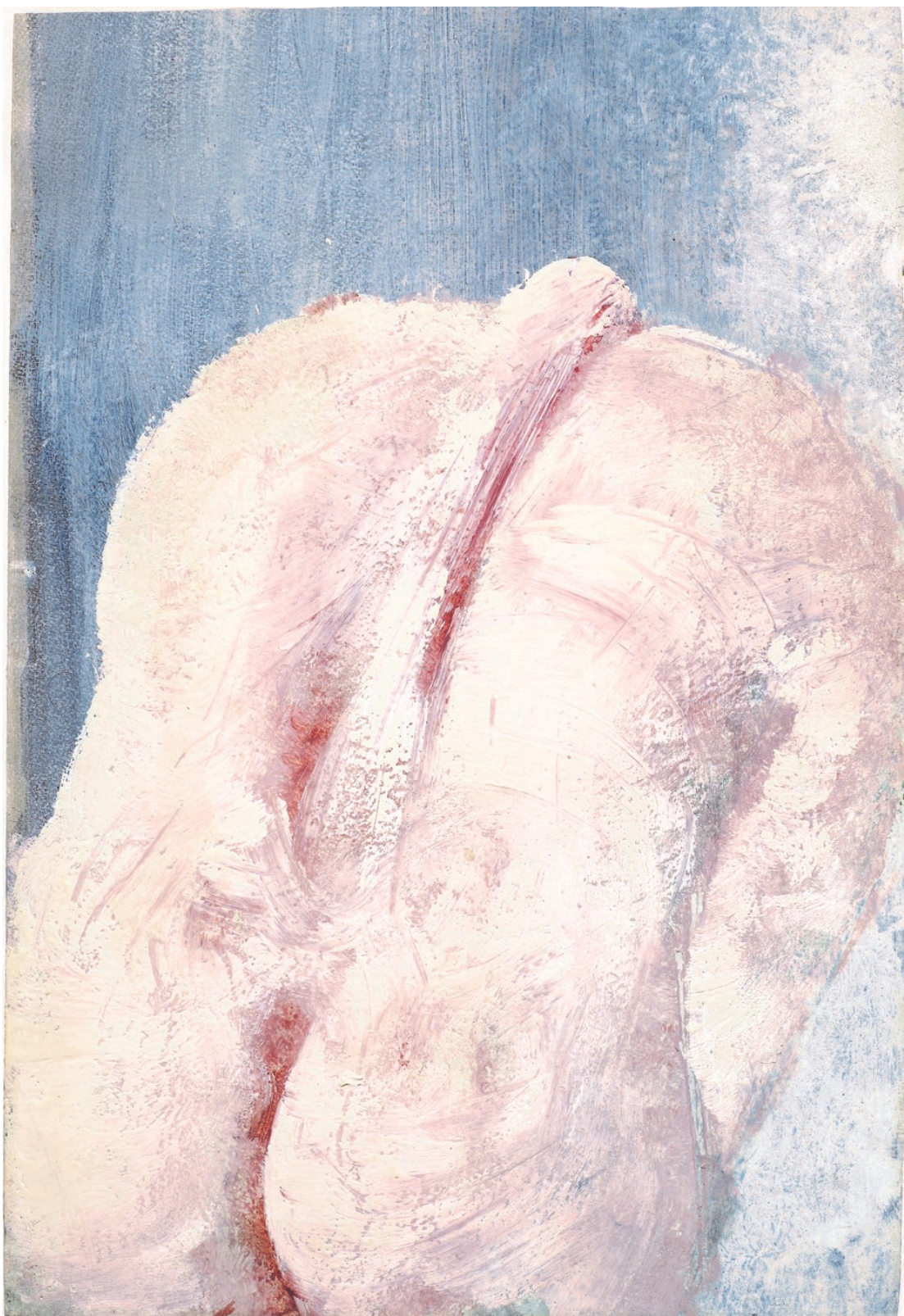
Dos féminin , acrylique sur papier, 38,5 x 26,5 cm, 1980, Paris.