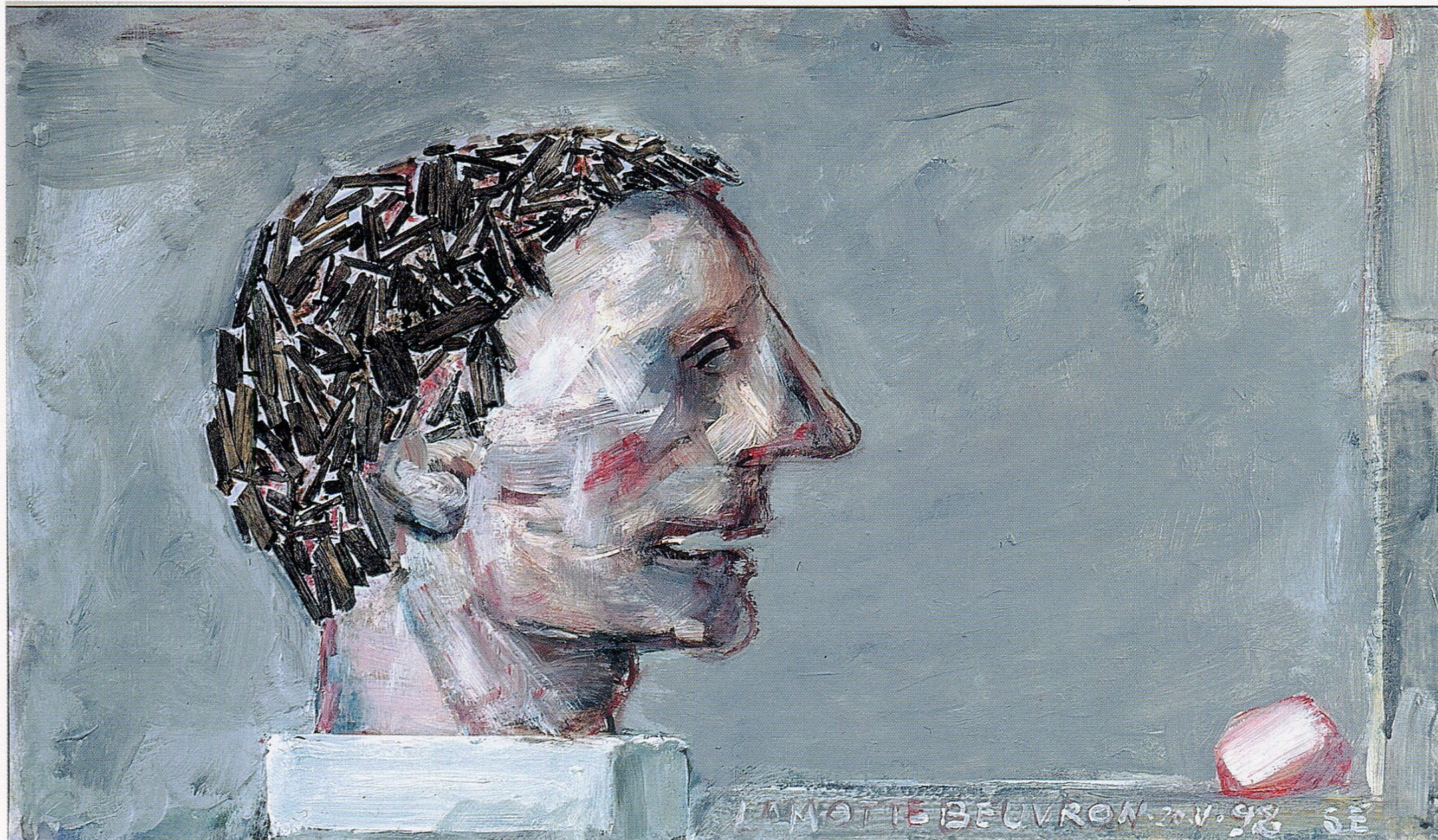
63 - TÊTE DE LA FORÊT DE LA MOTTE-BEUVRON - 1998

Tête de la forêt de la Motte-Beuvron , acrylique et collage sur carton, 34 x 57. Paris, 1998.